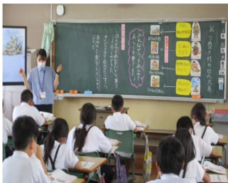
【板書にも思考の流れが表されます】