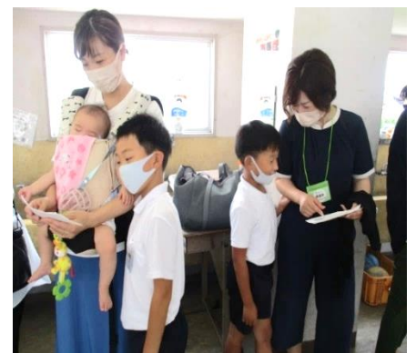
【お家の方との交流もありました】