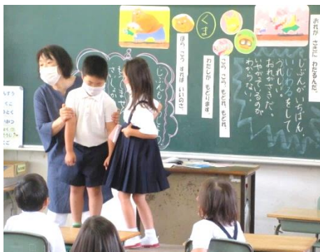
【「はしのうえのおおかみ」の役割演技】