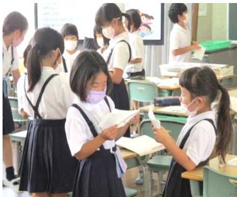
【友だちと考えを交流しています】

よりよく生きるための基盤となる道徳性を養うため、自分を見つめ、物事を多面的・多角的に考え、自分の生き方について考えを深めることを通して、道徳的な判断力、心情、実践意欲と態度を育てることを目指しています。