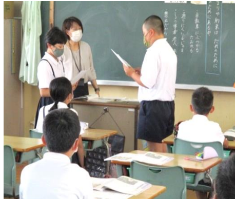
【自分の考えていたことを発表】